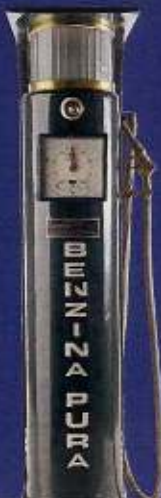
Pag. 50 Riapre il Museo Fisogni