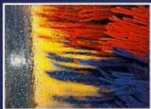
Pag. 44 È nata Assolavagisti